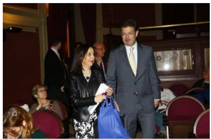
La magistrada del Tribunal Supremo Margarita Robles y el ministro de Justicia, Rafael Catalá, antes del inicio de la conferencia